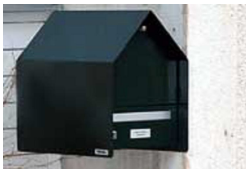
Art. no 10.400 Dim. 310 x 430 x 400 mm

Boîte aux lettre individuelle pour l'extérieur avec casier pour le courrier et compartiment à paquets avec une porte basculante