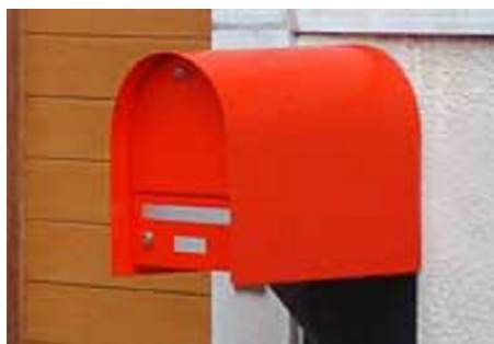
Art. no 10.450 Dim. 310 x 395 x 400 mm